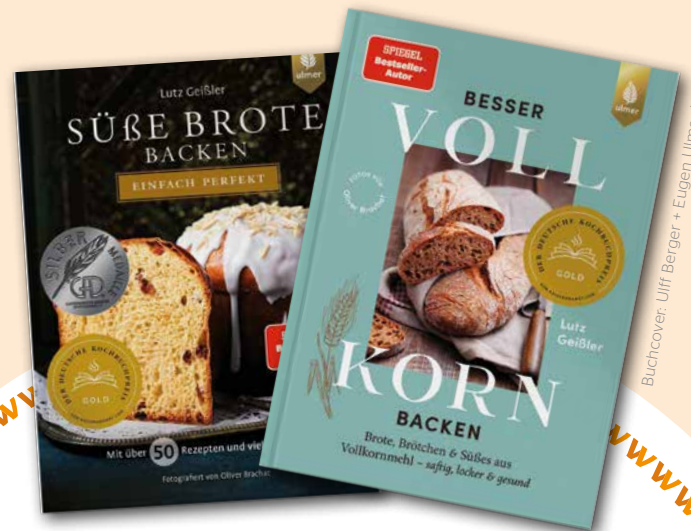
Buchcover: Ulff Berger + Eugen Ulmer KG