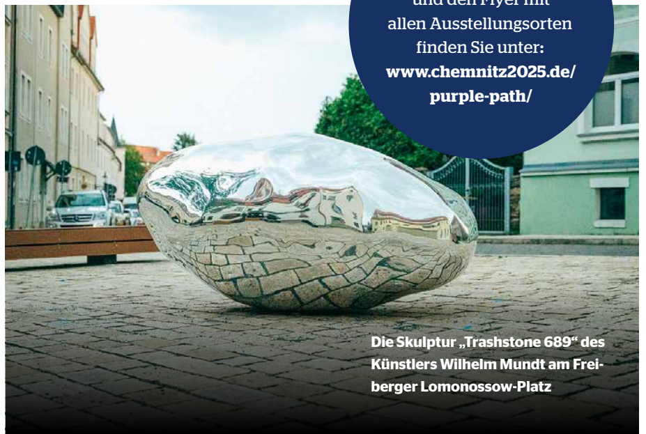
Die Skulptur „Trashstone 689“ des Künstlers Wilhelm Mundt am Freiburger Lomonossow-Platz