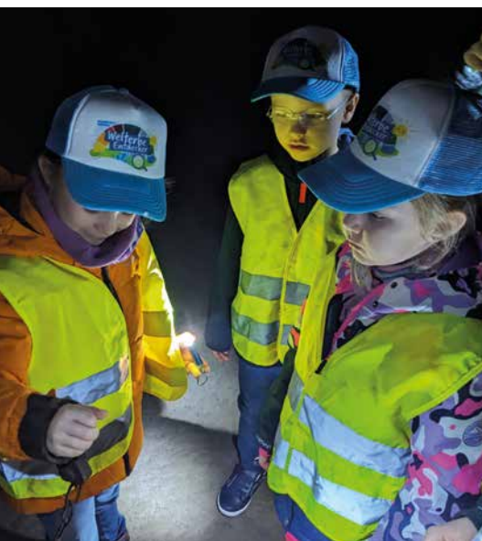
Mit Taschenlampen erkundeten die Kinder der Kita Löwenzahn den Rathauskeller

Die diesjährige Welterbe-Entdecker-Parade findet am Bergstadtfest-Freitag, dem 27. Juni, um 10 Uhr statt.