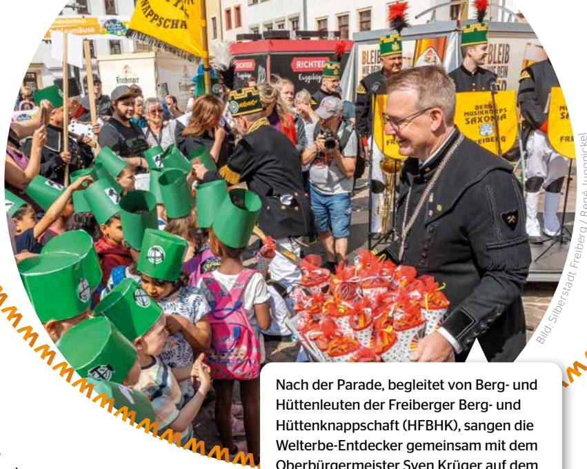
Nach der Parade, begleitet von Berg- und Hüttenleuten der Freiburger Berg- und Hüttenknappschaft (HFBHK), sangen die Welterbe-Entdecker gemeinsam mit dem Oberbürgermeister Sven Krüger auf dem Obermarkt das Steigerlied.