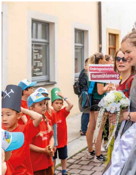
Das große Finale ist alljährlich die Welterbe-Entdecker-Parade am Bergstadtfest-Freitag. Sie hat sich inzwischen in der gesamten Welterberegion etabliert und Nachahmer gefunden