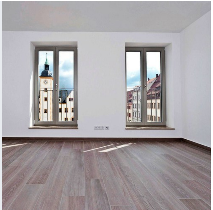
Blick aufs Rathaus

In Freibergs Zentrum treffen Individualität, Moderne und historische Architektur aufeinander. Wohnen in der Altstadt ist "in". Die Bezeichnung als „Stadt der kurzen Wege“ wird hier geprägt. Kunst, Kultur und Geschichte erleben Sie direkt vor der Haustür.