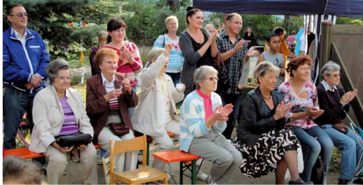
Familienfest in Friedeburg - nur eines der vielen Angebote des Lichtpunkt e. V.