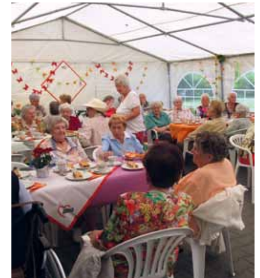
Sie ist selbst Mieter der SWG und für alle SWG-Mieter da: die Freiburger AWO

gen dafür, dass der Einkaufszettel beim nächsten Mal vollständig ist. Die Mehrzahl der Teilnehmer und Cafébesucher sind Mieter im Betreuten Wohnen der AWO. Willkommen sind aber auch alle anderen Bewohner und SWG-Mieter. Gleiches gilt für die Inanspruchnahme der kostenlosen und vertraulichen Schuldner- und Insolvenzberatung, wo Menschen geholfen wird, die durch Arbeitslosigkeit, Krankheit oder andere Schicksalsschläge in finanzielle Schieflage geraten sind. Kein Grund, sich zu schämen, finden die AWO-Mitarbeiter, denn Tatenlosigkeit und Verzweiflung vergrößern das Problem oft noch.